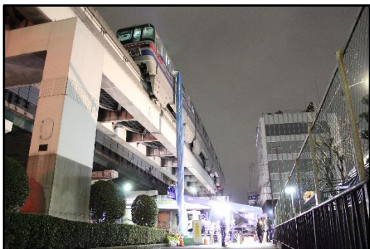
降下救出（脱出シューター）