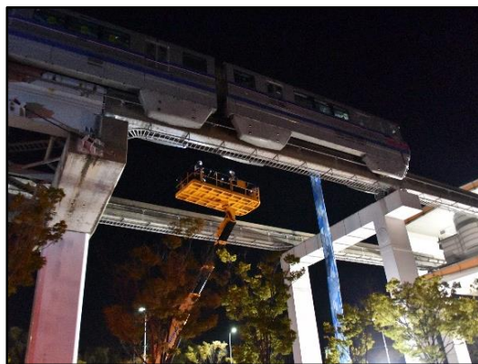
高所作業車を使用した点検